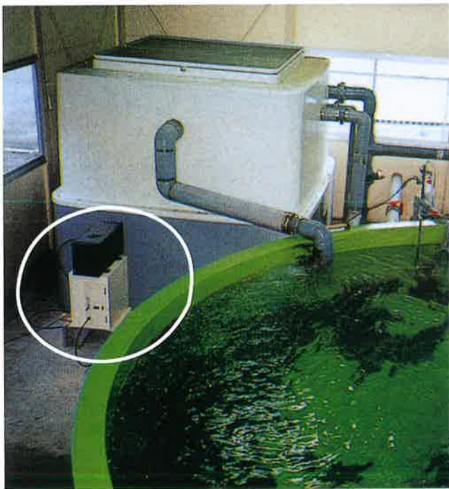
使用例：モデルSA002（水槽、循環ろ過槽は別途）