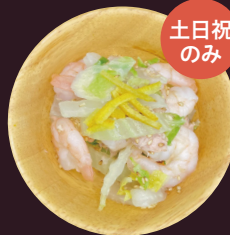
ゆず薫る 白菜と小エビのサラダ