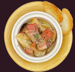
厚切りベーコンと茸のアヒージョ