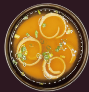
滋賀県 霊仙三蔵味噌