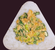
こまつな (小松菜とツナ)