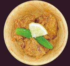
ダイコウ醤油 白ダシ醤油を使った 旨だし唐揚げ