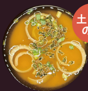
大分県 九州そだち麦