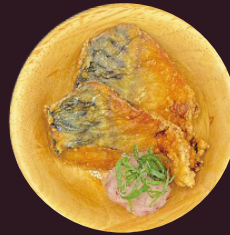
鯖の竜田揚げ 梅おろし添え