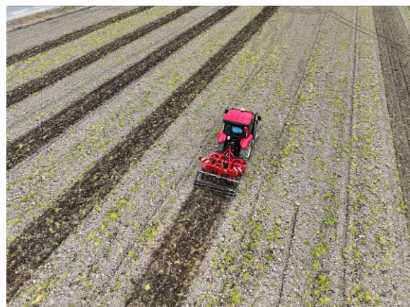
<作業幅設定による碎土作業とラップ幅設定による耕起作業イメージ>