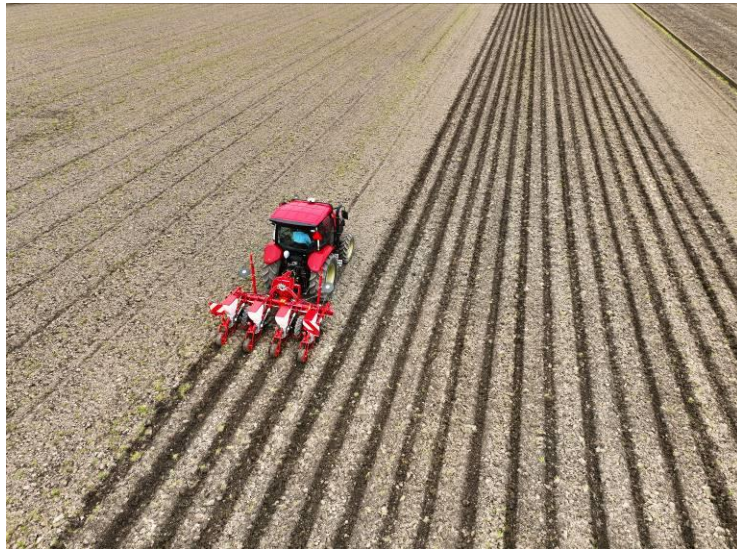
<直進アシスト機能による播種作業イメージ>