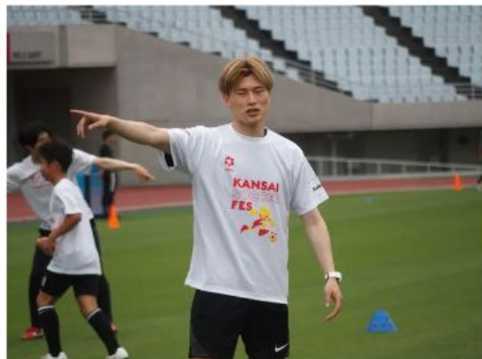
KANSAI SOCCER FESで指導するセルティックFW古橋亨梧

元Jリーガー田中裕介氏（38）がプロデュースするサッカーイベント「KANSAI SOCCER FES 2024」が20日、ヤンマースタジアム長居で行われ、FW古橋亨梧（29＝セルティック）が参加し