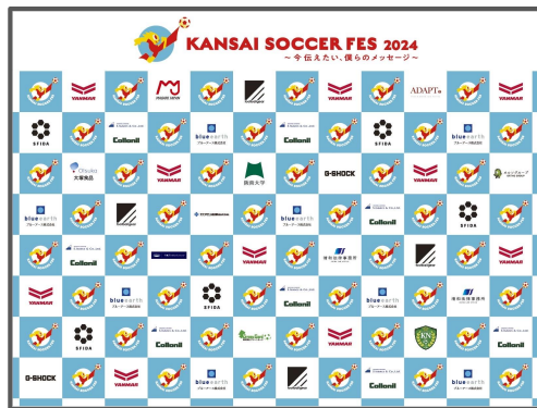
インタビューボード