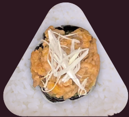
なす 茄子と肉みそ