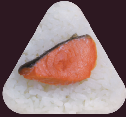
焼き 焼 鮭