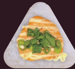
あぶ めんたい 炙り明太ねぎマヨ