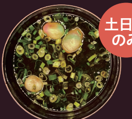
あいちけん 愛知県 八丁味噌