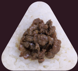
おうみぎゅう 近江牛しぐれ