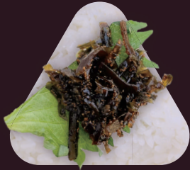
こんぶ 昆布とたらこの佃煮