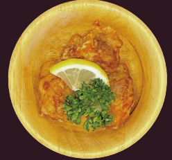
ダイコン醤油 白ダシ醤油を使った 旨だし唐揚げ