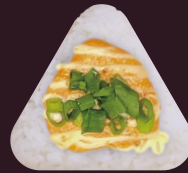
炙り明太ねぎマヨ