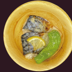
塩こうじを使った 鯖の塩レモン焼き