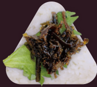
昆布とたらこの佃煮