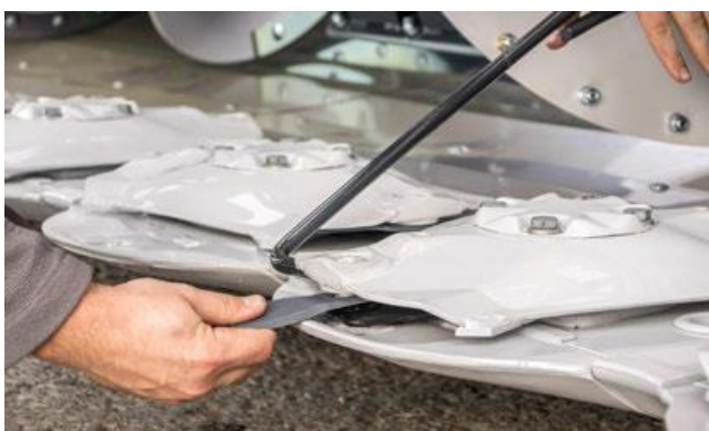
ナイフは工具1つで楽々交換