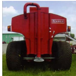
下部からの散布（1方向）

散布位置はご希望により設定可能。 上部からの散布、下部からの散布など 条件に応じて選択できます。 排出口も1~2方向で選択ができます。