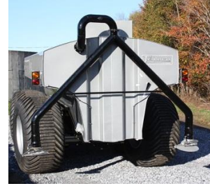
下部からの散布（2方向） ※オプション 型式：998-SL-2SPREAD