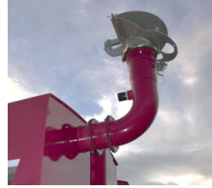
上部からの散布（1方向）