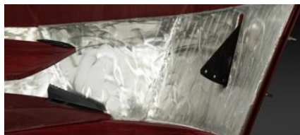
※実物はミキサーと同色となります