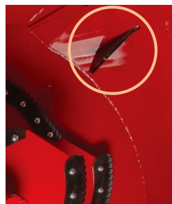
内部から見た様子