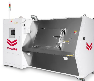
<バイオコンポスター「YC100」>

FOOMA JAPANではSDGsの取り組みの一環として、持続的に発展可能な展示会を目指し生ごみの再資源化に取り組んでいます。今回、FOOMA JAPAN 2024の会場で発生した生ごみの一部をバイオコンポスター「YC100」で処理し、生成物を土壌改善に役立てます。