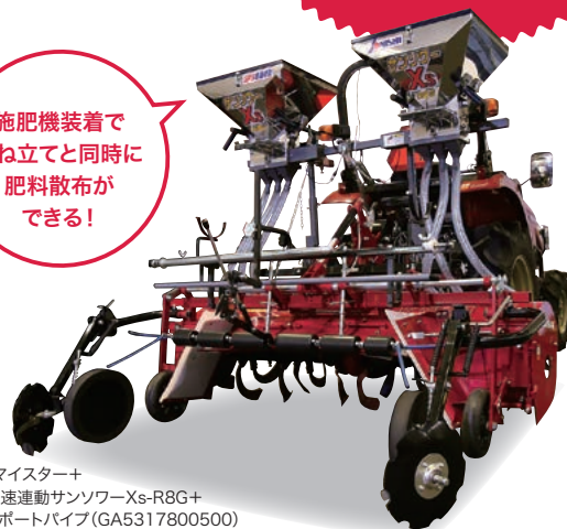
ベッドマイスター+ GPS車速連動サンソワーXs-R8G+ 延長サポートパイプ(GA5317800500)