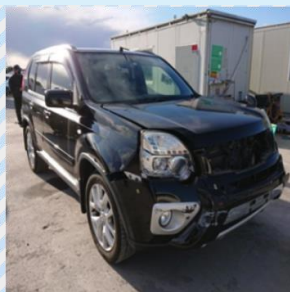
H25年 エクストレイル