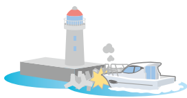
マリナーにある施設(桟橋や補給設備)や航路標識、防波堤など港湾設備に損害を与えてしまった