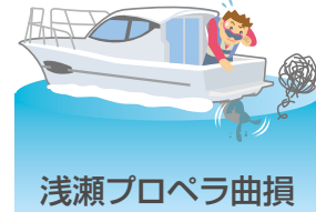
浅瀬プロペラ曲損