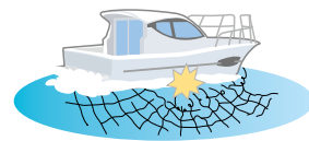
誤って漁網を切ってしまった