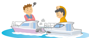
漁船やプレジャーボート、貨物船などの他の船に衝突して船体や積荷に損害を与えてしまった