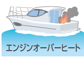
エンジンオーバーヒート