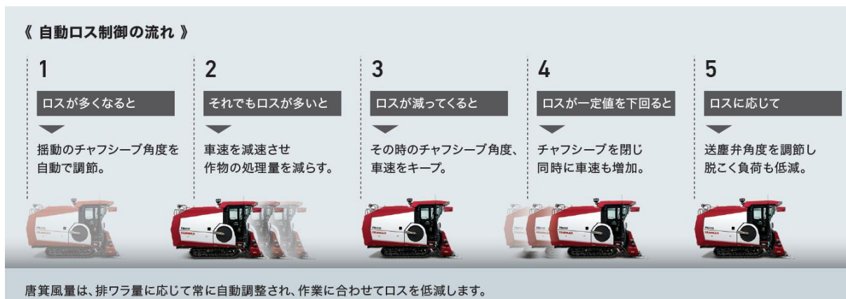
<自動ロス制御の流れ>

自動ロス制御はヤンマー独自の自動制御技術で、こぎ胴・揺動での籾のロスを検知し選別・車速・送塵・風量を自動調節します。選べる5段階の制御レベルに応じて設定されたロスの上限值を超えると制御が働きロスを低減します。本機能を自動モードと併用することで、安定的な刈取作業を自動で行うことが可能になります。