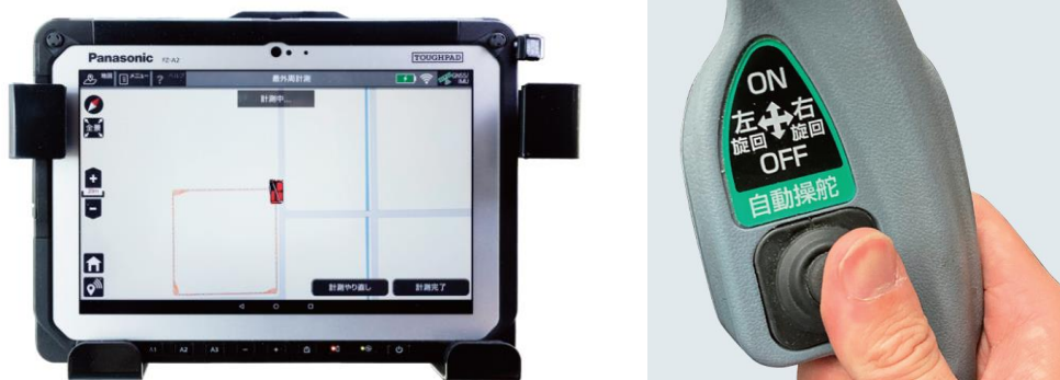
<専用タブレット、ハンドルに搭載した「自動操舵入・切スイッチ」>

自動運転中でも、あらかじめ設定した内容や作業状況を確認することができます。また、自動モードの設定もタブレット操作で行うことができます。ハンドルには自動操舵入・切スイッチを搭載しているため、タブレットを操作しなくてもスイッチ1つで自動操舵の入切が可能です。