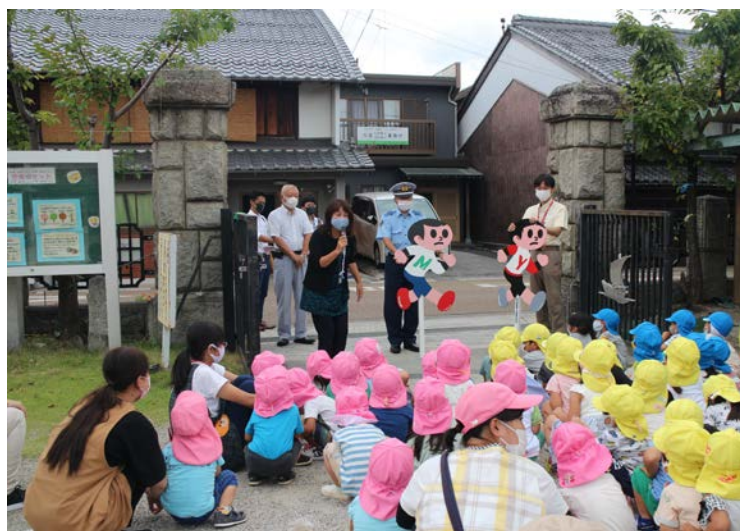
<地元幼稚園前への設置の様子>