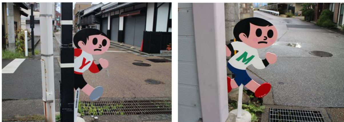
<地域に設置した「とびだしとび太」ヤンマーミュージアムバージョン>

北国街道は小中学生や幼稚園児が通学やお散歩道として利用していますが、通り抜け車両も多く、子供との交通事故が懸念される道路です。今回設置の交通安全標識「とび太くん」により、おもいやり運転をするドライバーが増加し交通事故の抑止につながることを期待しています。