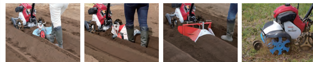
ミニアロポ培土器 [丸うね] ミニうね立て器 [台形うね] 内盛整形器 [丸うね (台形うね)] ブルースパイラル [除草]

いろいろな作業に使えます。アタッチメントをセットすれば、作物にあった多彩な作業が行えます。