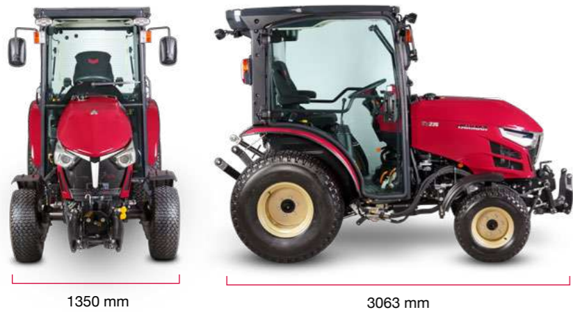
La largeur et la hauteur peuvent varier en fonction du type de pneu

Les tracteurs YT2 ont été conçus et développés pour qu'on ait « plaisir à les posséder ». Et c'est précisément ce que Yanmar a réussi à faire.