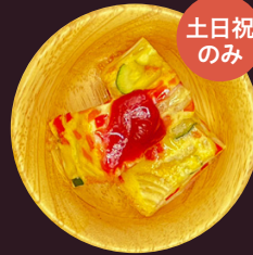
スパニッシュオムレツ