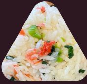
桜えびと菜の花 混ぜごはん