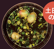
愛知県 カクキュー 八丁味噌