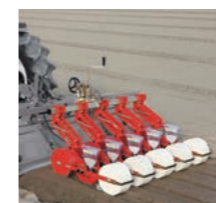
〈アグリテクノサーチ〉